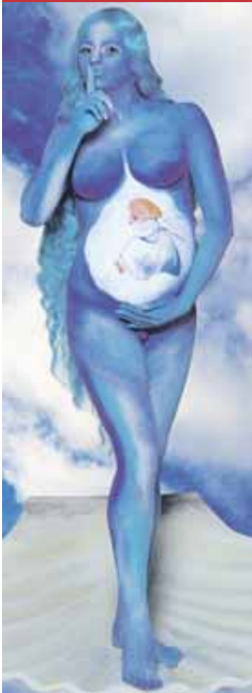
Una imagen de 'bodypainting'.