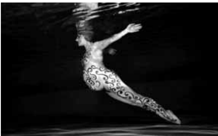
Fotografía de 'body painting' bajo el agua del mar.