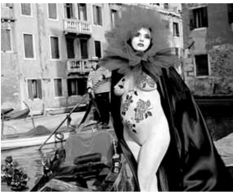
Una de las imágenes que recoge el libro, tomada en Venecia.