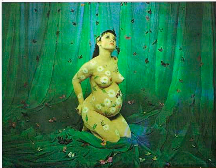
En este proyecto han participado hasta 50 modelos diferentes.