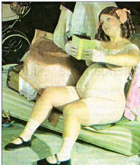
El maquillaje y los decorados se adaptaban de propio para cada mujer.